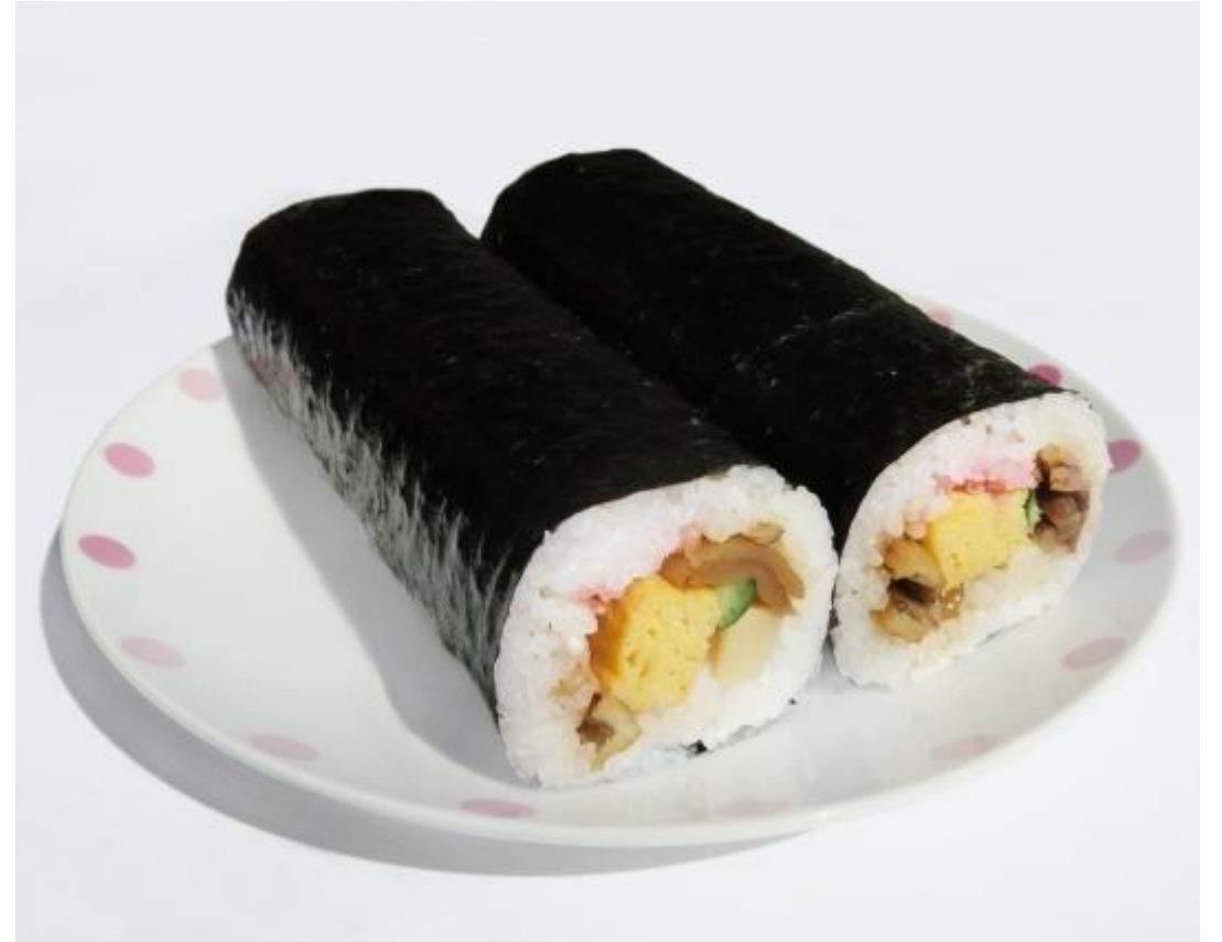
えほうまき 恵方巻 (のりまき)